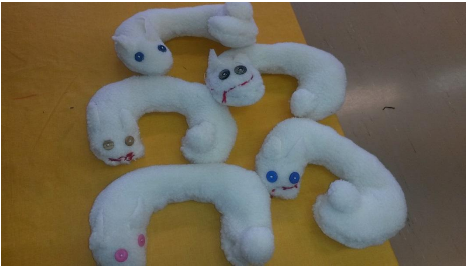
2.lk niskatyynyt teddykankaasta