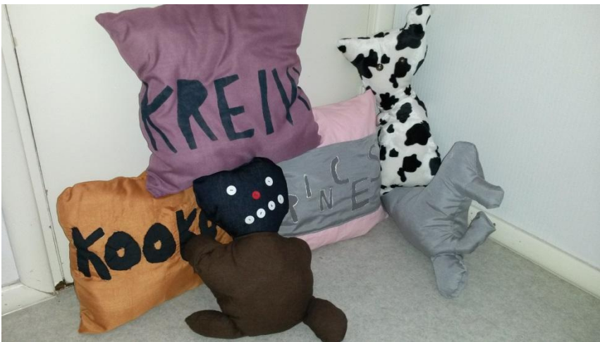
4.lk itsesuunnitellut ja toteutetut Tyynyt