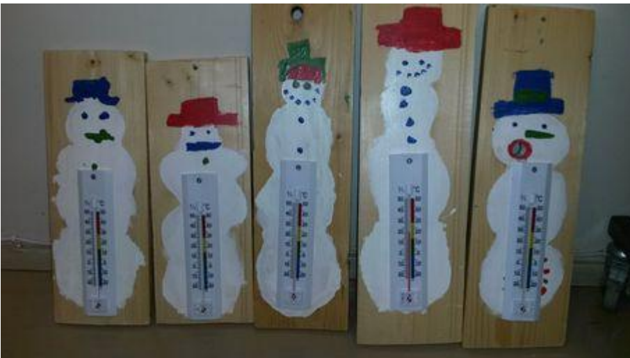
2.lk puutyö Lumiukkolämpömittari